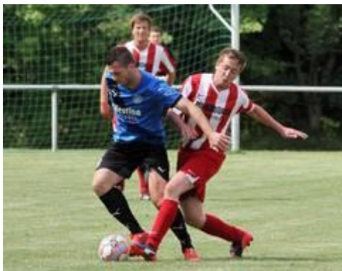
Die Gastgeber entschieden die Partie in der zweiten Halbzeit. „Da hat uns Steinbach nach allen Regeln der Kunst auseinander genommen“, erzählt TSV-Coach Marcel Müller, der nur mit einem dezimierten Kader antreten konnte. Die Steinbacher nutzten ihre Torchancen konsequent aus und schraubten nach einer 2:1-Führung zur Pause das Ergebnis

Burghaun (tg) - Fußball-Verbandsligist SV Steinbach hat sich im Testspiel mit 8:1 (2:1) gegen den Gruppenligisten TSV Künzell durchgesetzt.